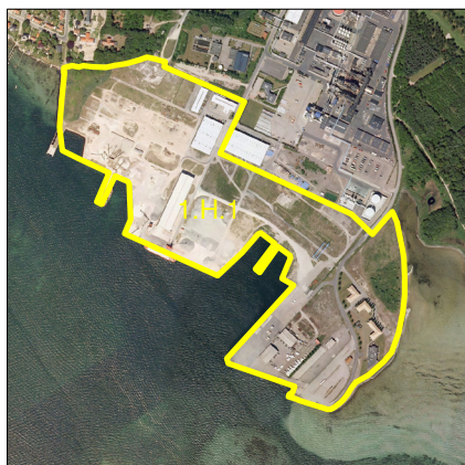
Eksisterende afgrænsning af rammeområde i Kommuneplan 2001

Dette kommuneplantillæg er indarbejdet i forslag til Kommuneplan 09, som endnu ikke er endeligt vedtaget.