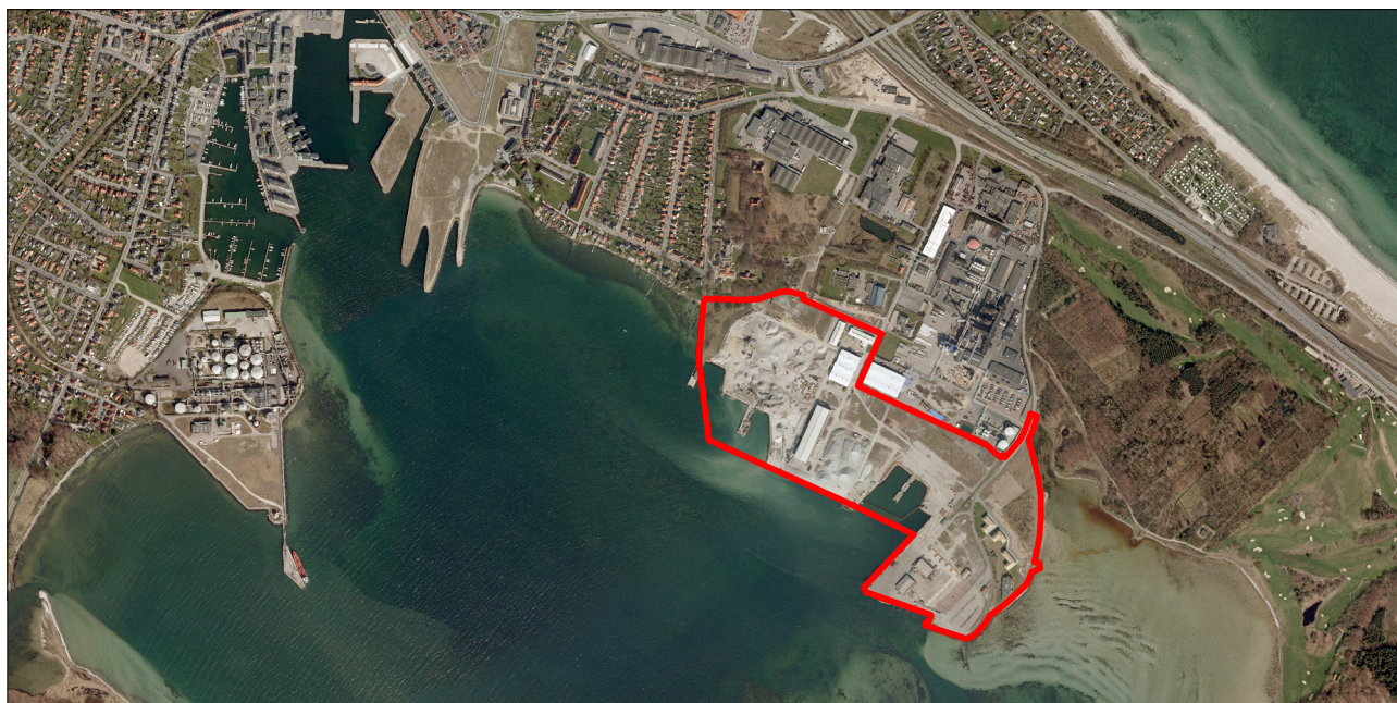
Ny rammeafgrænsning af Lindholm Havn vist på oversigtskort over Nyborg Fjord

Af de generelle retningslinier fremgår, at der ved erhvervslokalisering skal sikres passende afstand til eksisterende eller planlagt støjfølsom anvendelse, og der skal fastlægges hvilke virksomhedstyper, der kan placeres i området under hensyn til omgivelsernes følsomhed. Anlæg og bebyggelse der medfører støjbelastninger, som kan påvirke naboerne skal placeres bag ved støjvolden.