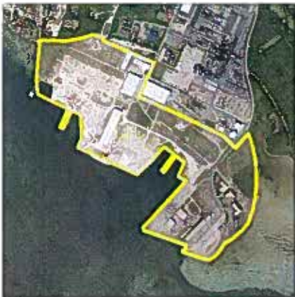
Eksisterende afgrænsning af rammeområde i Kommuneplan 2001

Dette kommuneplantillæg er indarbejdet i forslag til Kommuneplan 09, som endnu ikke er endeligt vedtaget.