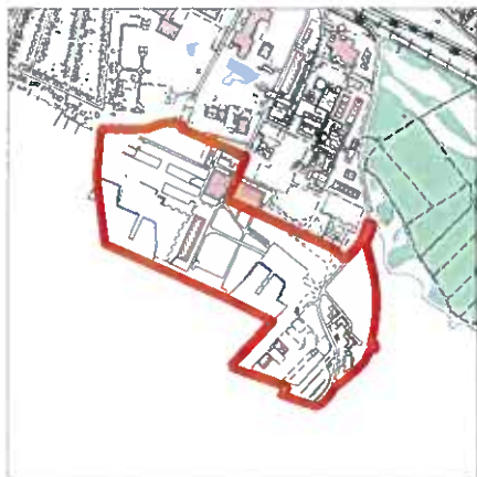
Rammeområde 1.H.1 i Kommuneplan 2001 er det samme som rammeområde 1.E.5 til havneformål i forslag til Kommuneplan 09.