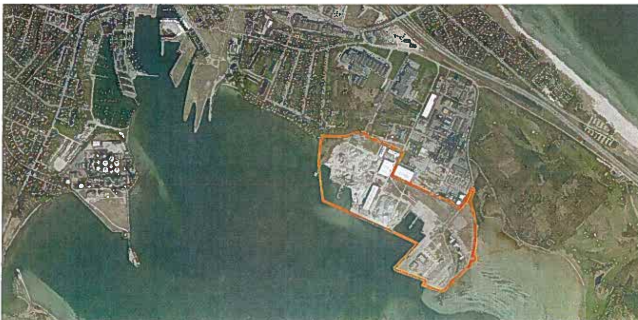
Ny rammeafgrænsning af Lindholm Havn vist på oversigtskort over Nyborg Fjord

Af de generelle retningslinier fremgår, at der ved erhvervslokalisering skal sikres passende afstand til eksisterende eller planlagt støjfølsom anvendelse, og der skal fastlægges hvilke virksomhedstyper, der kan placeres i området under hensyn til omgivelsernes følsomhed. Anlæg og bebyggelse der medfører støjbelastninger, som kan påvirke naboer, skal placeres bag ved støjvolden.